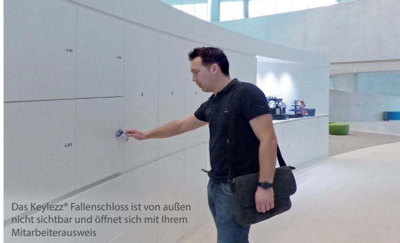
Das Keylezz® Fallenschloss ist von außen nicht sichtbar und öffnet sich mit Ihrem Mitarbeiterausweis