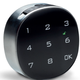
Keylezz® Turn PIN mit Touch-Zahlen-Display

Weitere Schlösser – individuell für Ihre Bedürfnisse