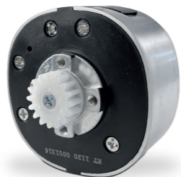
Keylezz® Turn FLEX mit flexiblem Schließmechanismus für Spezial- und Exklusivmöbel