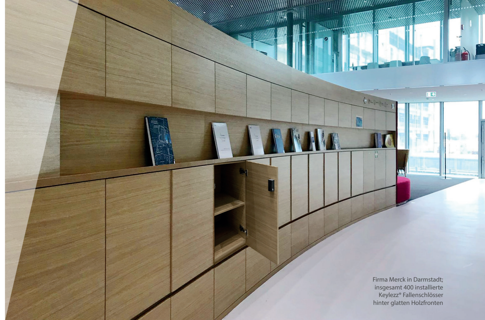
Firma Merck in Darmstadt; insgesamt 400 installierte Keylezz® Fallenschlösser hinter glatten Holzfronten

Ihr Mitarbeiterausweis ist der Schlüssel